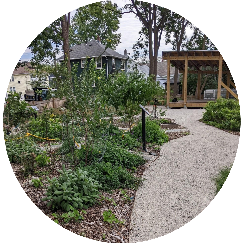
Edgewater Food Forest, Mattapan