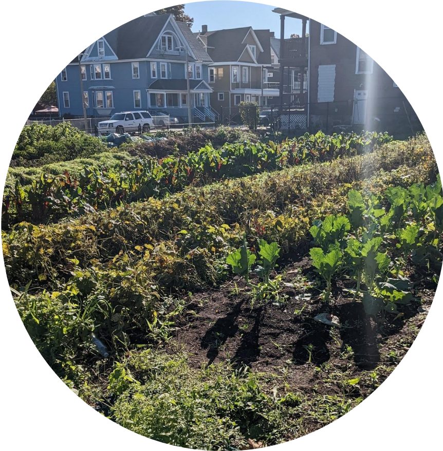
The Food Project – East Cottage Farm