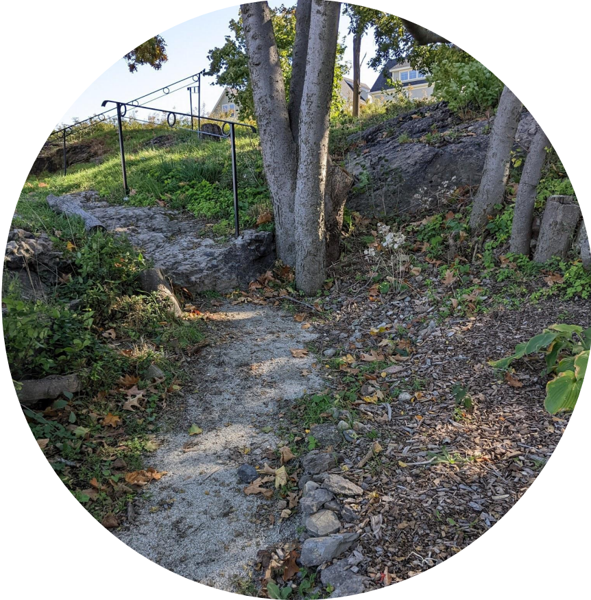
Jardín Savin Hill Wildlife, Dorchester