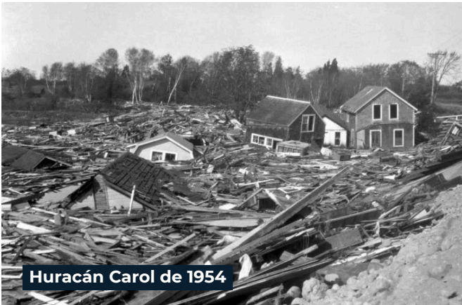
Huracán Carol de 1954

El huracán Carol de categoría 3, con ráfagas de viento de 135 mph, causó 68 muertes y daños por USD 461 millones en 1954.*